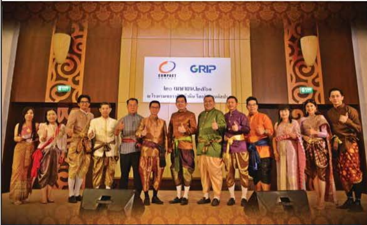
คอมแพ็ค เบรก เดินหน้าความร่วมมือ ด.สยามฯ

ฉบับพิเศษ vol. 36 May - June 2018 www.compact-brake.com